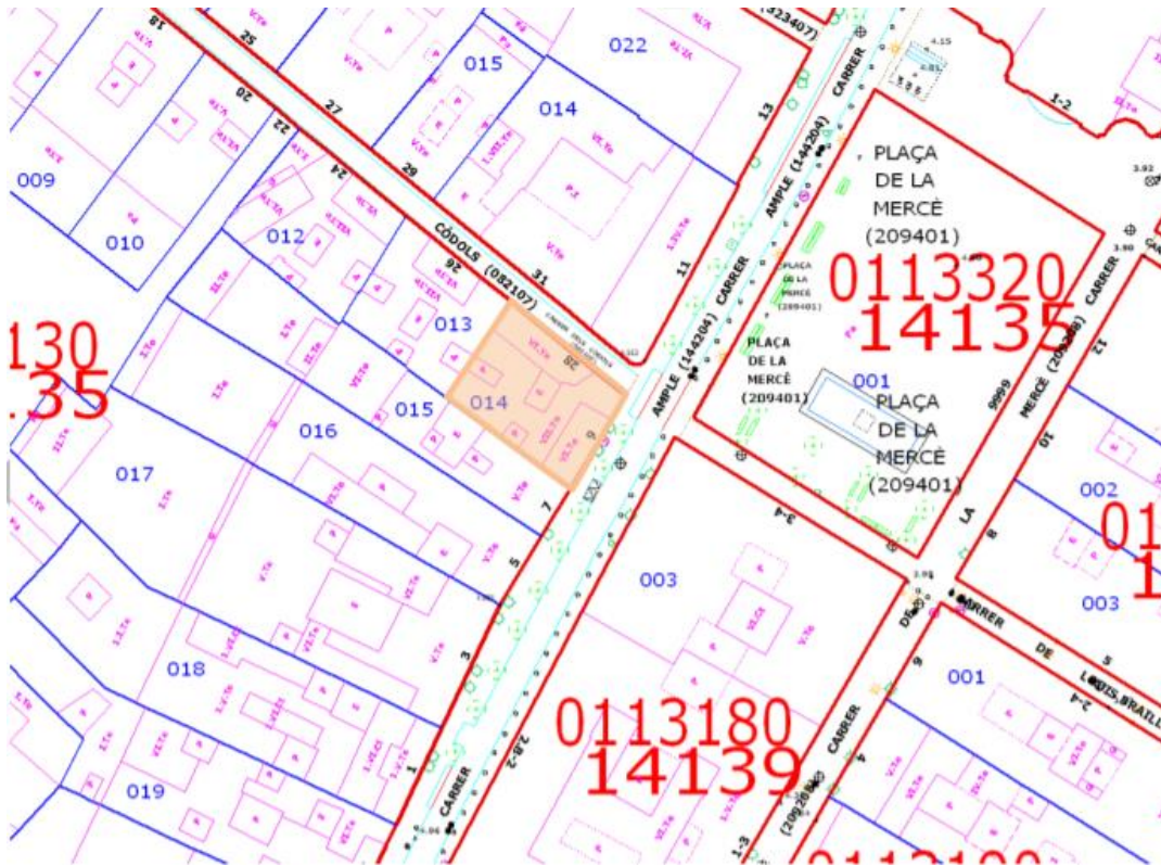
Localització de l'edifici concret