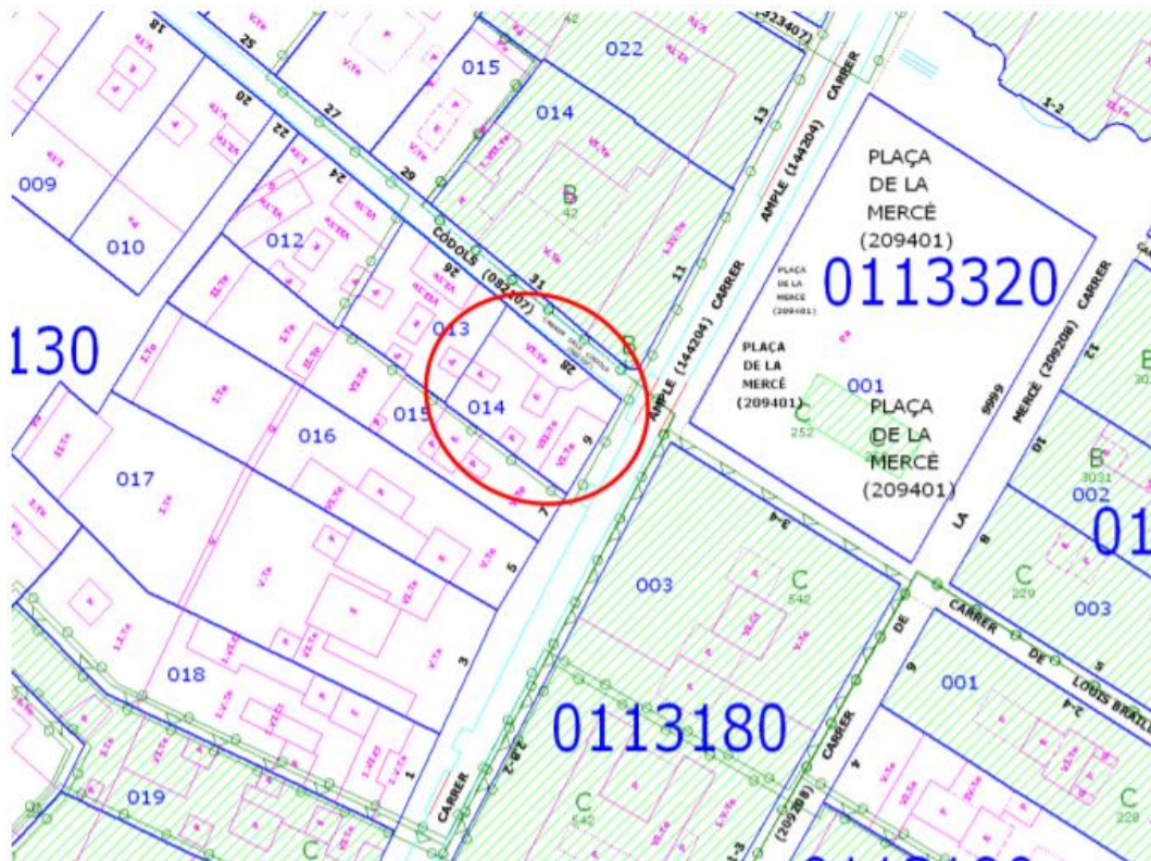
Localització de l'edifici concret