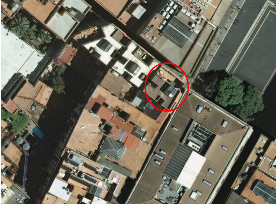
Localització de l'edifici per imatge aèria